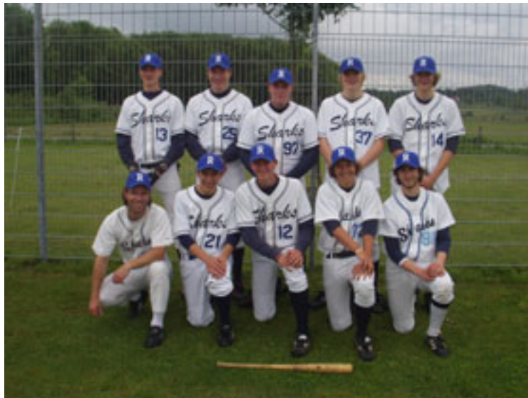
1. Mannschaft Abteilung Baseball