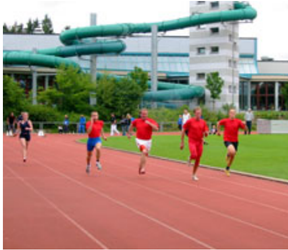
Bilder des 100 Meter Sprints